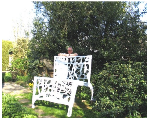
Ontwerp van de gedichtenbank

Ingrid wil graag op de hoogte worden gehouden van de activiteiten die plaatsvinden in Park Voorveldse Polder en wil graag een keer meelopen met een rondleiding.