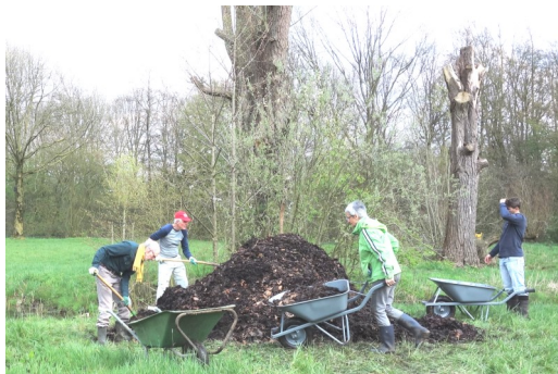
Opbouw van de slangenbroeihoop

In overleg met coördinatoren van broeihoopen in de omgeving is vorig jaar besloten de slangenbroeihoop op te bouwen achter op het veld met de oude wilgen.